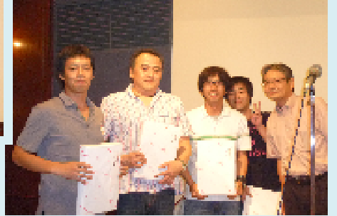
▲団体3位 ダイソー・帝人化成労組 「ダイソー・化成合同チーム」