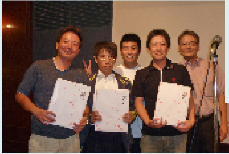
▲団体準優勝 伊予鉄道労組「ネクスジェンチーム」