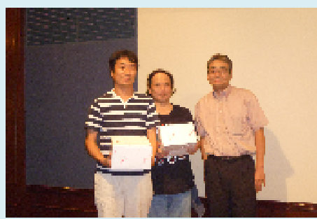
▲団体優勝 全国一般労組