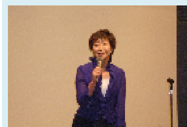
▲永江衆議院議員あいさつ