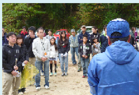
▲山内福祉・ボランティア活動委員会委員長からの注意事項説明に耳を傾けます