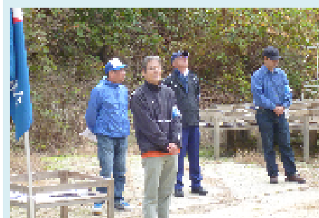
▲三浦議長（中予支部長）よりあいさつ