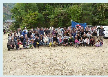
▲出発前にハイチーズ！今から清掃です

私たち組合員は地域に帰れば一市民です。また、社会貢献活動・ボランティア活動は労働組合の役割のひとつとして重要であり、助け合いの精神は労働組合の原点です。今後もこのような取り組みを継続的に行っていきたいと考えています。